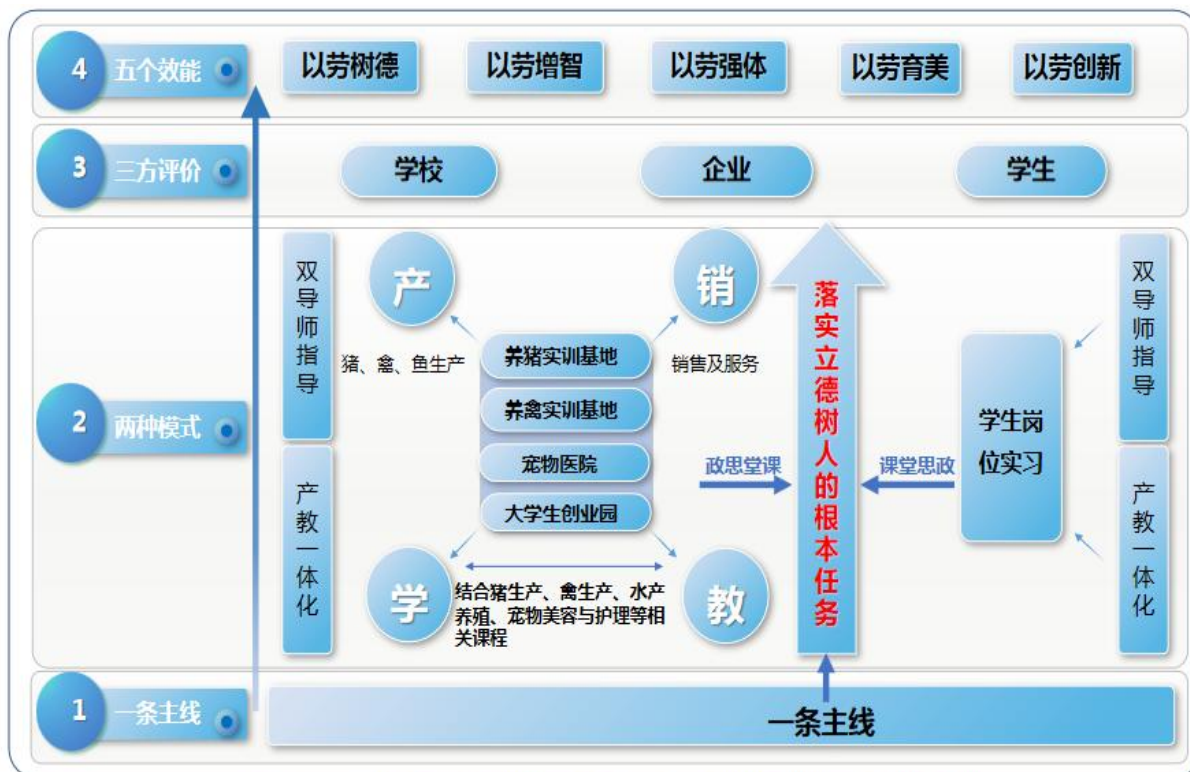
图2 畜牧兽医专业群“1234”一体化课堂革命模式图

以岗赛课证融通为抓手，创新并实施“1234”一体化课堂革命。畜牧兽医专业“1234”一体化课堂革命模式见图2。