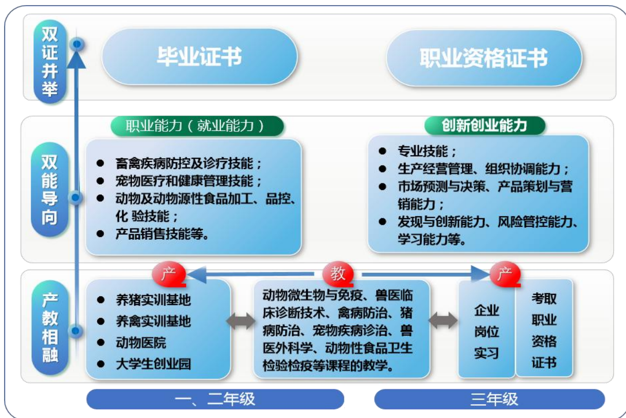
图1 动物医学专业“产教相融，双能导向，双证并举”的人才培养模式图