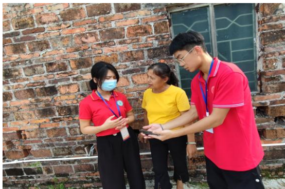
(给养殖户讲解水产专业知识)

因受台风天气的影响，我们为期三天的三下乡实践活动推延到了 8 月 26 日，在这几天的空暇时间里，我们召开了会议明确了我们接下来要执行的每个步骤，因此我们对三下乡活动有了更进一步明确的计划。很快便来到了越约定的时间继续开展我们第二天的活动，在我们轻装简行后便出发，在出发途中我们要做好不怕热不怕累的心理准备，一路上，每个队员都要注意安全，服从领导，听从指挥。