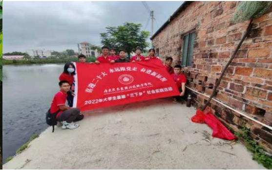
(与养殖户合影留念)