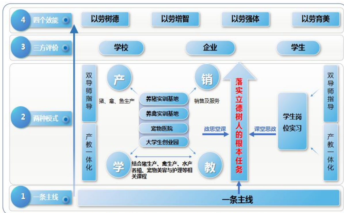
图2 畜牧兽医专业群“1234”一体化课堂革命模式图

“一条主线”：坚持以党建引领、落实立德树人的根本任务为主线，把社会主义核心价值观体系融入职业教育全过程，实施课堂思政。