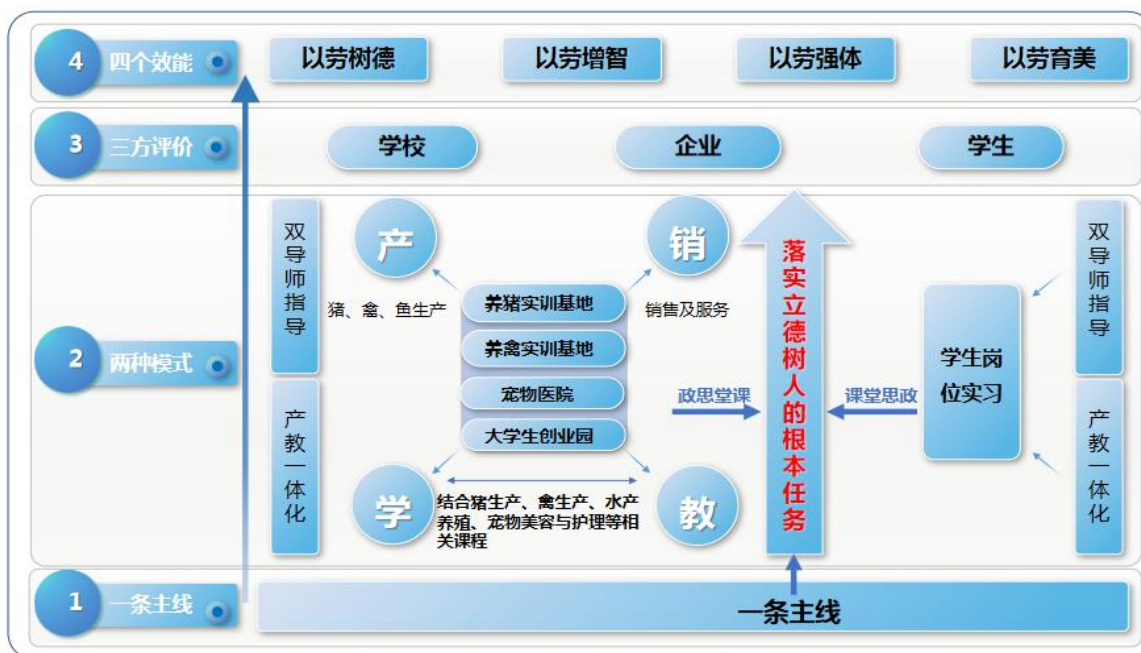
图2 畜牧兽医专业群“1234”一体化课堂革命模式图

以岗赛课证融通为抓手，创新并实施“1234”一体化课堂革命。水产养殖技术专业“1234”一体化课堂革命模式见图2。