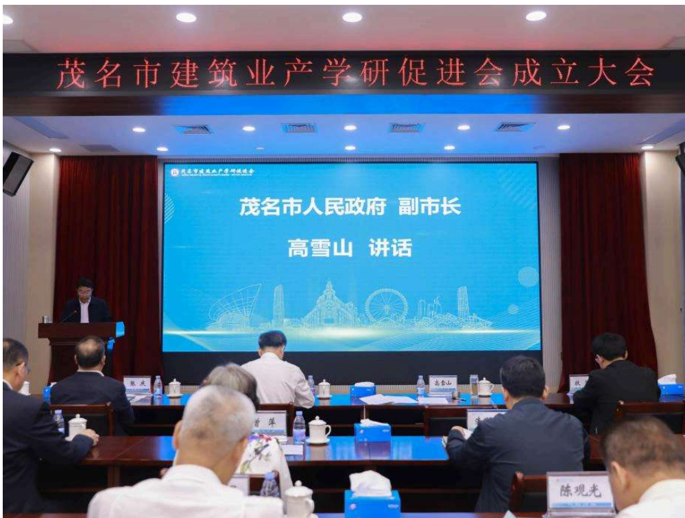
上图：副市长高雪山讲话

高雪山副市长代表市委、市政府对茂名市建筑业产学研促进会成立表示祝贺。高雪山指出，建筑业是我市的传统优势产业和支柱产业，希望促进会要为建筑业转型升级搭建更广阔的平台，各参会单位要紧紧围绕建筑业规划发展，积极探索建筑业产学研合作机制，进一步推进我市建筑业高质量发展。