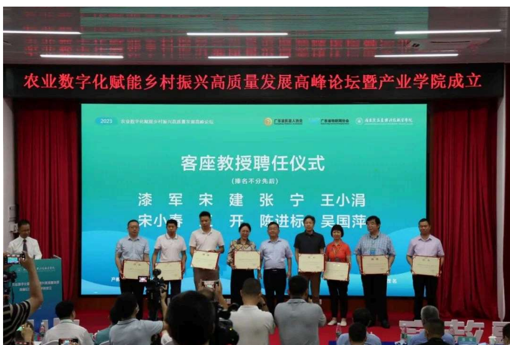
图7：聘任29位专家学者为广东茂名农林科技职业学院客座教授