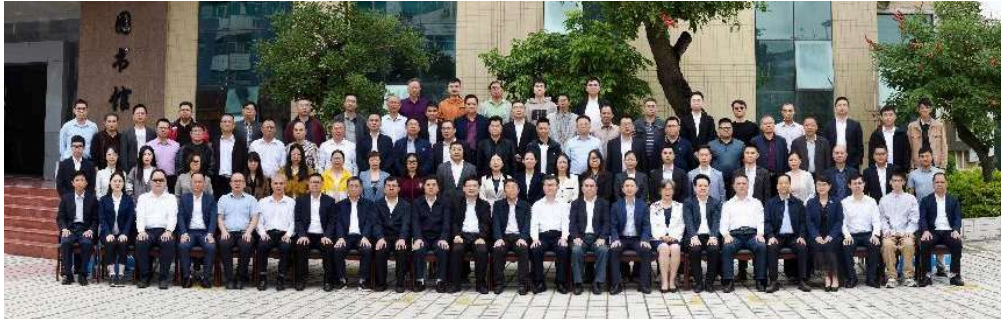
上图：茂名市建筑业产学研促进会成立大会合影