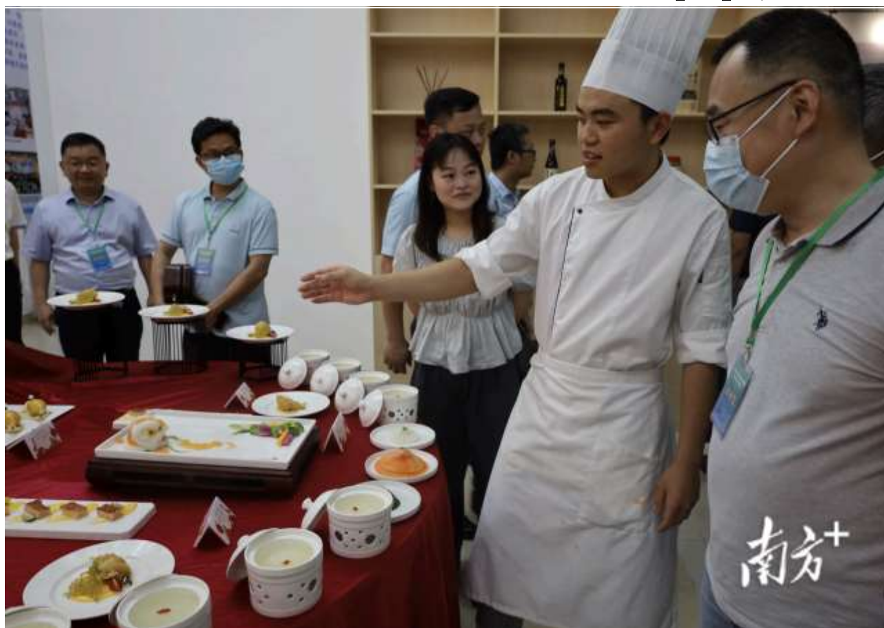
学院大师傅介绍粤菜。

农业数字化是实现乡村振兴高质量发展的必由之路和破题之笔。茂名是农业大市，连续3年农业总产值超过千亿元。近年来，茂名持续加快数字农业基础通信建设与信息化规划建设，积极推动政产学研用合作，创新乡村振兴发展和消费体验新模式，通过农业数字化赋能乡村振兴。