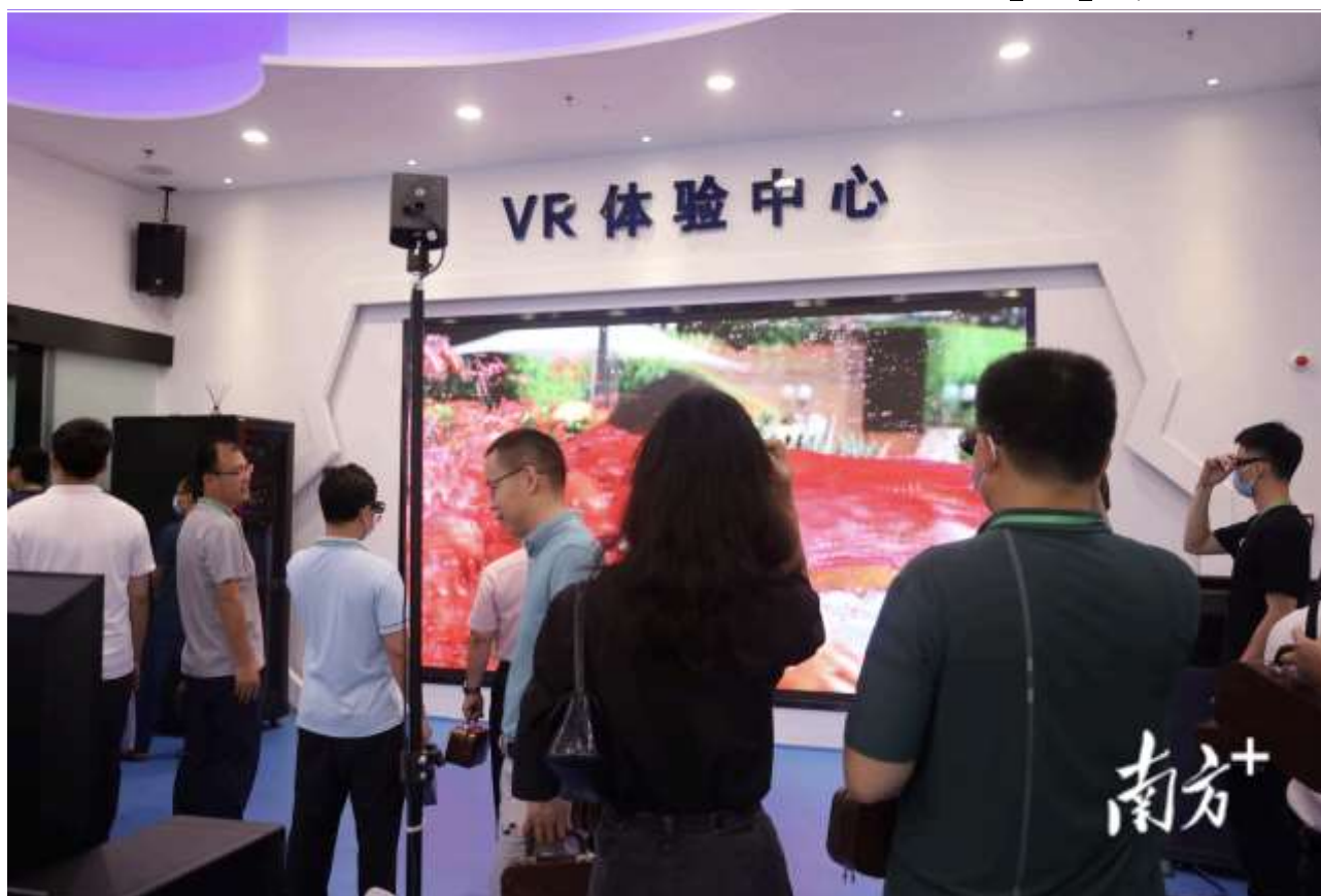
学院VR体验中心，感受满满科技感。

5月21日，农业数字化赋能乡村振兴高质量发展研讨会暨产业学院成立活动在广茂农林职院展开。此次活动中，智能机器人产业学院和智慧农业产业学院在广茂农林职院成立，17家企业现场签约。