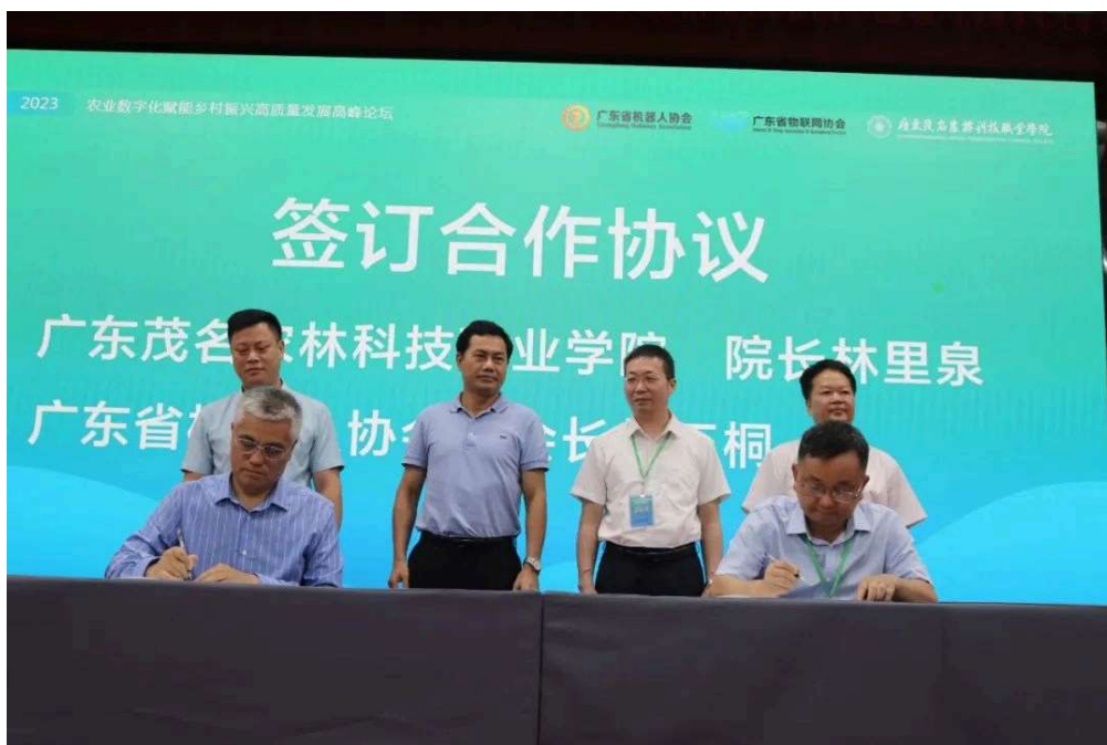
图5：广东茂名农林科技职业学院与广东省机器人协会签订合作协议