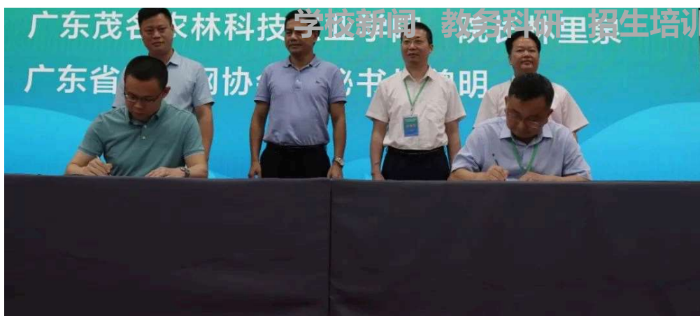
图6：广东茂名农林科技职业学院与广东省物联网协会签订合作协议