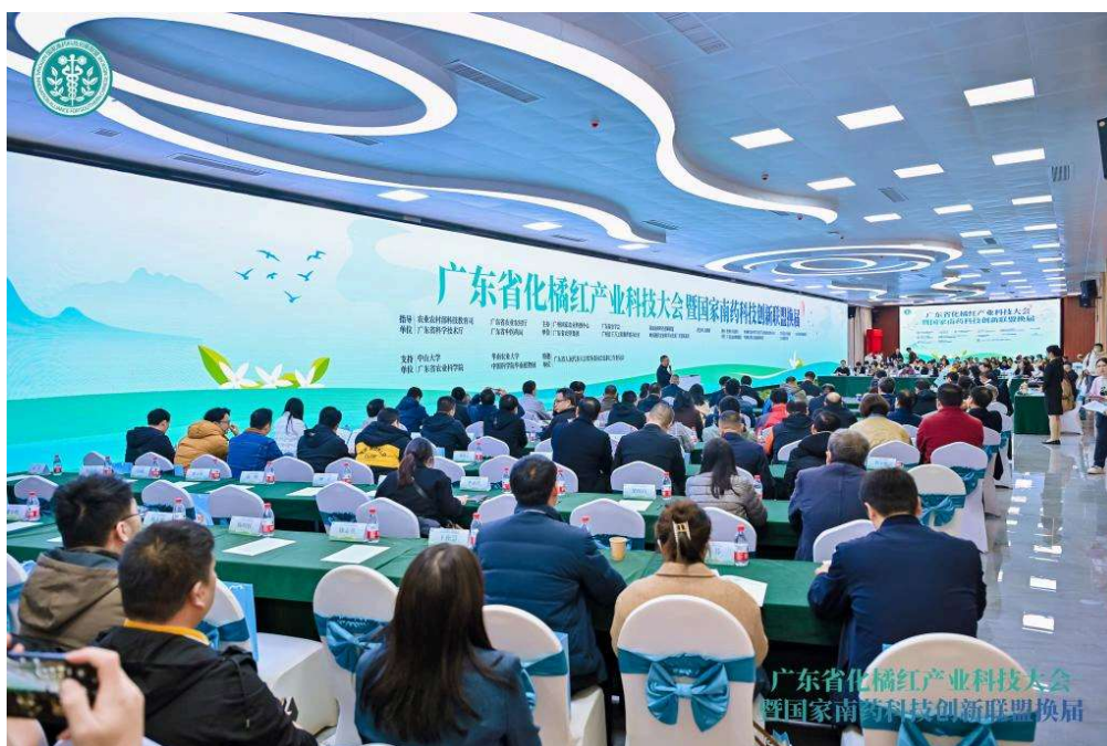
上图：广东省化橘红产业科技大会暨国家南药科技创新联盟换届大会召开

2023年12月17日，广东省化橘红产业科技大会暨国家南药科技创新联盟换届大会在广州国家农业科创中心隆重召开，我校加入国家南药科技创新联盟，成为联盟理事单位。