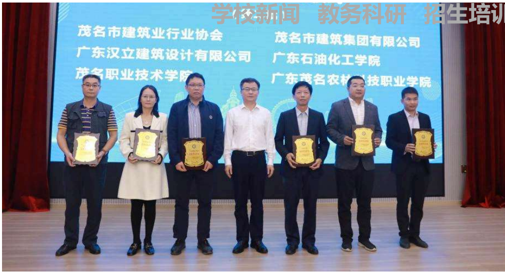
上图：市政协冯波副主席为副理事长单位授牌

高雪山副市长代表市委、市政府对茂名市建筑业产学研促进会成立表示祝贺。高雪山指出，建筑业是我市的传统优势产业和支柱产业，希望促进会要为建筑业转型升级搭建更广阔的平台，各参会单位要紧紧围绕建筑业规划发展，积极探索建筑业产学研合作机制，进一步推进我市建筑业高质量发展。