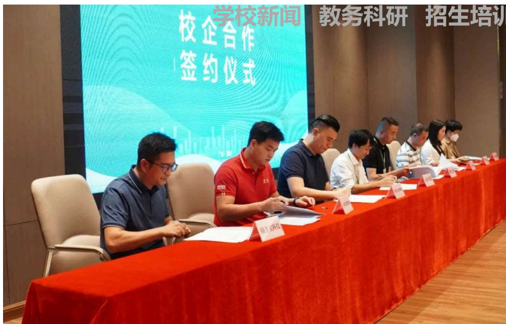
图10：8家企业与智慧农业产业学院签约

活动举办了圆桌会议及一系列研讨会，从政策和产业现状分析农业智慧化新形态、分享典型农业智慧化企业技术、探讨高职院校产教融合新农科人才培养实践、探究产教融合赋能乡村振兴人才培养模式，交流农业数字化转型探索实践中涌现的典型经验做法和应用场景，探讨现代农业产业人才需求问题及推进农业数字化转型的路径与策略。研讨会后，有来自广州、深圳、中山、江门等地的17家企业与刚揭牌成立的两个学院签约。