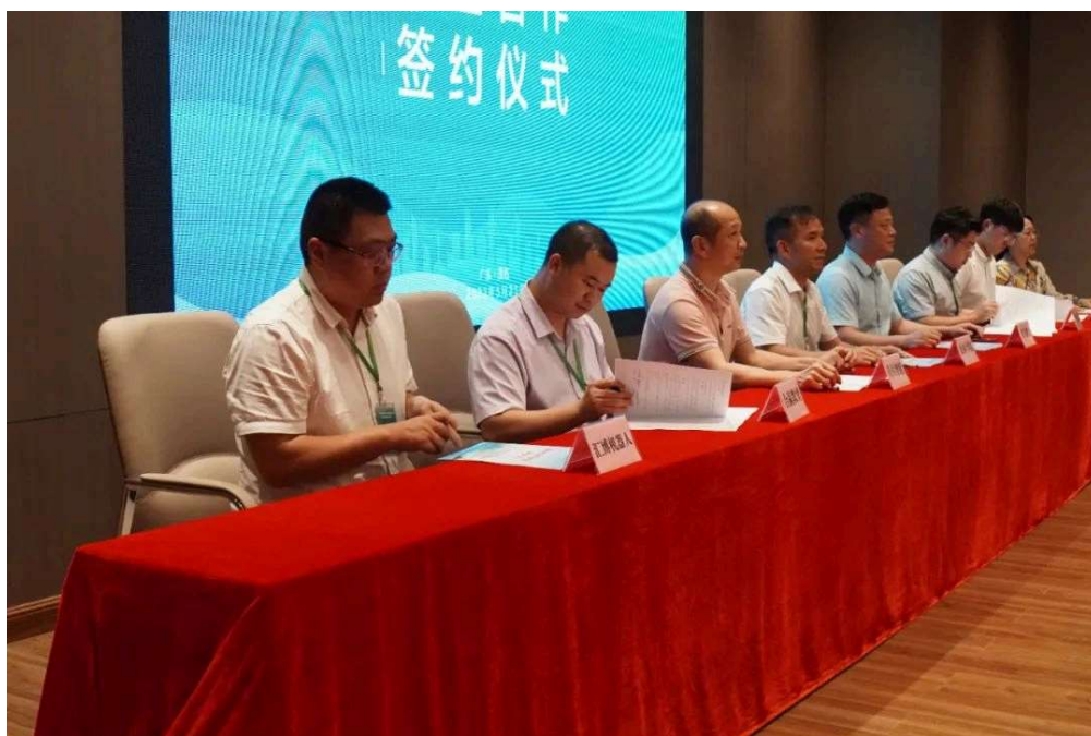
图8：发起成立“广东数字农业产教融合共同体”仪式