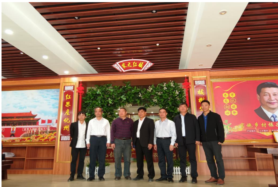
图14 学院领导带队赴化州市平定镇调研化橘红高质量发展

学院对接广东省“百千万工程”和茂名市“百墟千村振兴计划”，深入推进学院特色的助力乡村振兴“十百千万工程”（即“十支部联十村委员会、百师联百村、千生联千户、育万人兴万家”）。截至2023年底，11个党支部结合自身特点，分别找准对接1个村委会，带领村民发展“五树一鱼一桌菜”等茂名特色农业产业；另外已与化州平定镇政府、信宜钱排镇政府和高州根子镇公垌村委员会等签订校地合作协议，授予44家企业、24个村支部产学研基地牌、科技驿站牌共68个，派出2945人次师生奔赴基层一线，培训基层党员、农民等10763人次。