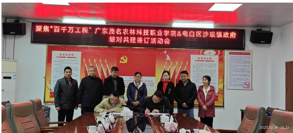
图 12 在电白区沙琅镇政府举行校镇结对共建签约仪式