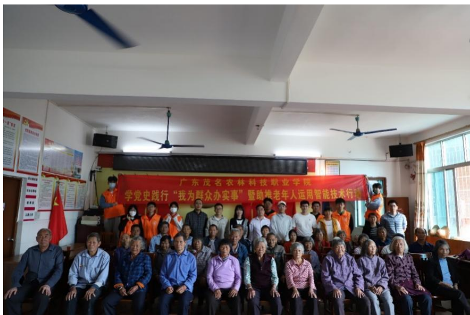
图 16 学院到荷塘村开展“助推老年人运用智能技术”行动