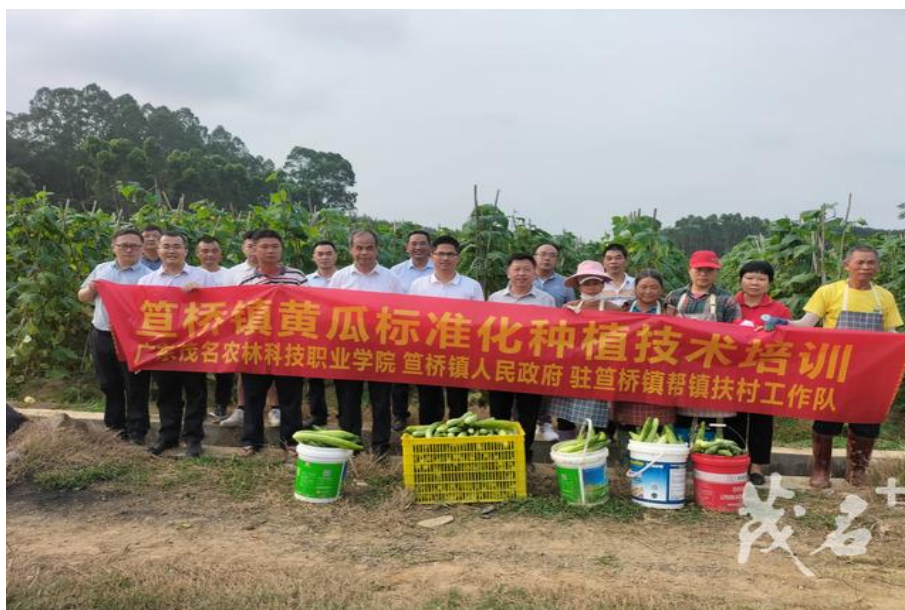
图4 化州市双桥镇黄瓜标准化种植技术培训