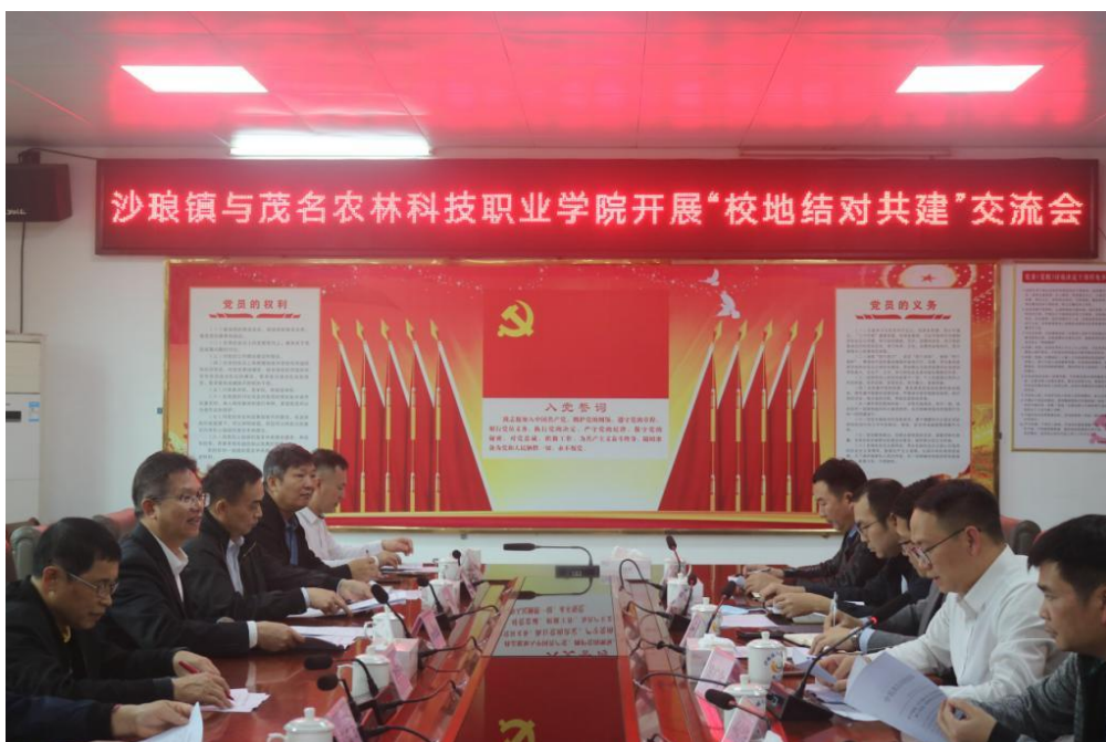
图 13 学院与沙琅镇“校地结对共建”交流活动现场

三是凝聚人才力量，为乡村振兴添智赋能。围绕新型职业农民和基层干部培养，学院采取“调出来提升、派进去指导、本地化培养”模式，培训各类型带头人、经营管理人员和专业化服务人员。2023年，学院通过村（社区）后备干部能力提升培训班、村（社区）“两委”干部示范培训班等项目，培养了县镇村基层干部 1416 名，有效提高了基层干部的政策水平、业务素质和服务能力；通过乡村振兴劳动技能培训等项目，培养了农村实用人才 2000 名。同时，学院