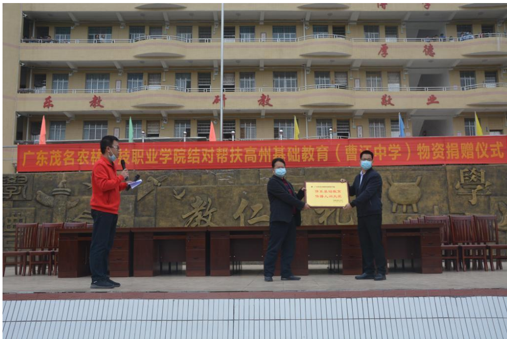
图 7 捐赠仪式现场

校开展志愿活动；捐赠教学办公桌椅 69 套、智能交互平板 4 套、台式计算机 6 套，累计投入帮扶资金 15 万元，在省教育厅考核中被评为良好。