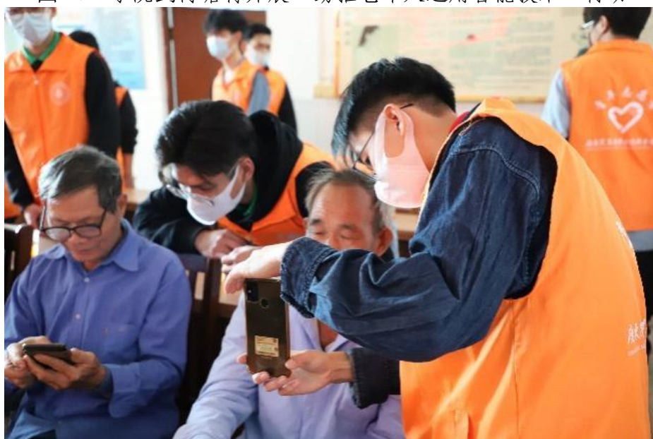
图 17 “助推老年人运用智能技术”行动活动现场