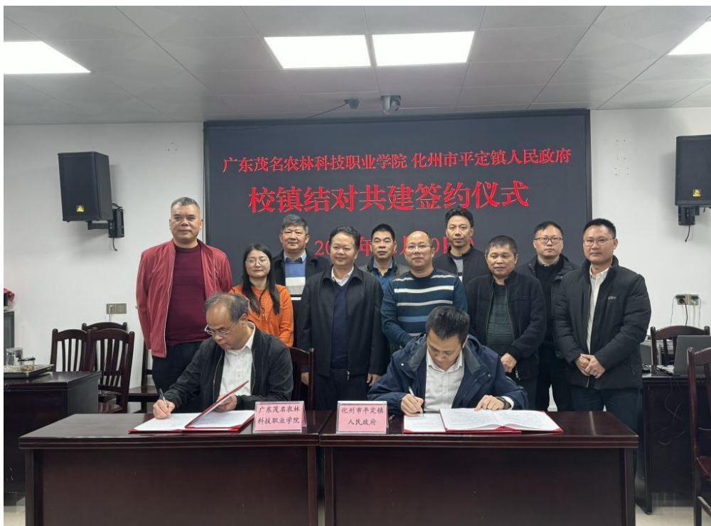
图 10 在化州市平定镇人民政府举行校镇结对共建签约仪式