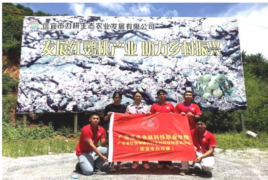
图 6 科技特派员团队助力信宜市白石镇乡村振兴

学院服务乡村振兴工作成效突出，在 2023 年省职业教育服务乡村振兴工作典型案例征集活动中，推选 的 10 个案例全部获奖，其中一等奖 2 项、二等奖 2 项、三等奖 4 项、优秀奖 2 项。