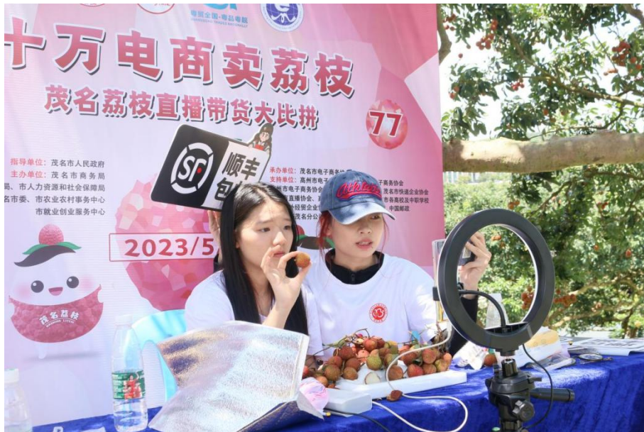
图2 师生团队参加“十万电商卖荔枝”全民营销大擂台直播带货大比拼活动