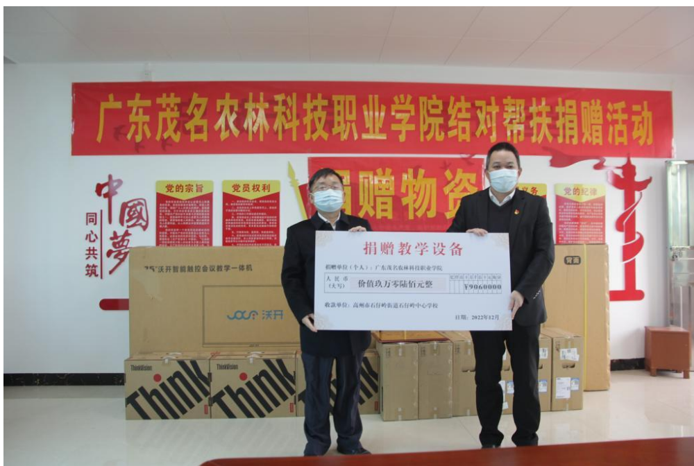
图 8 捐赠仪式现场