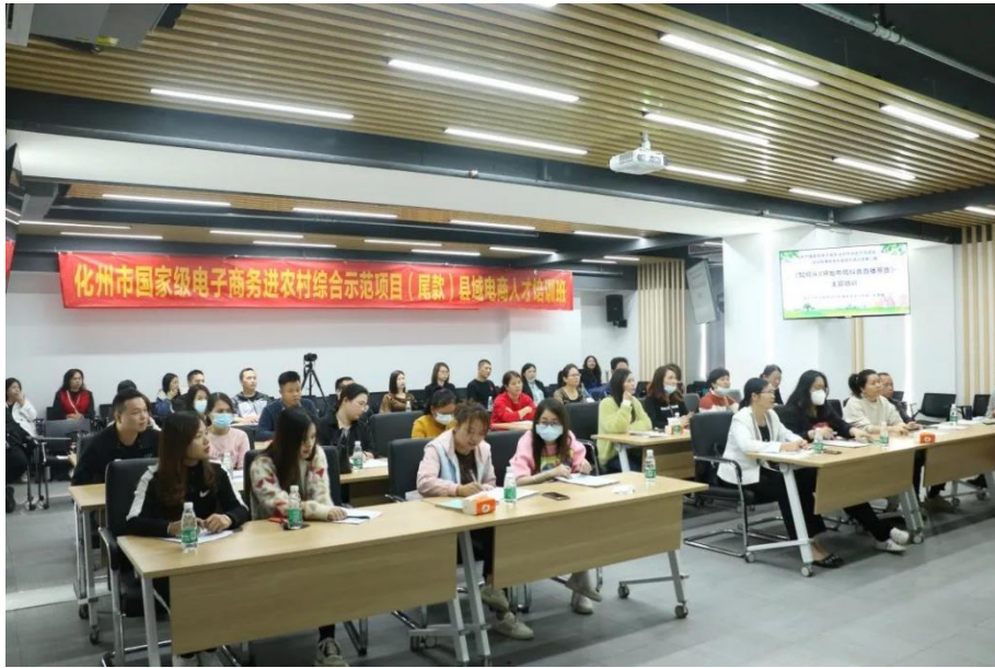
图 15 学院教师团队开展抖音直播专题提升培训

展《直播带货赋能乡村振兴》《直播+短视频带货助力消费帮扶农产品走出大山》等专题培训，培训近200人日。