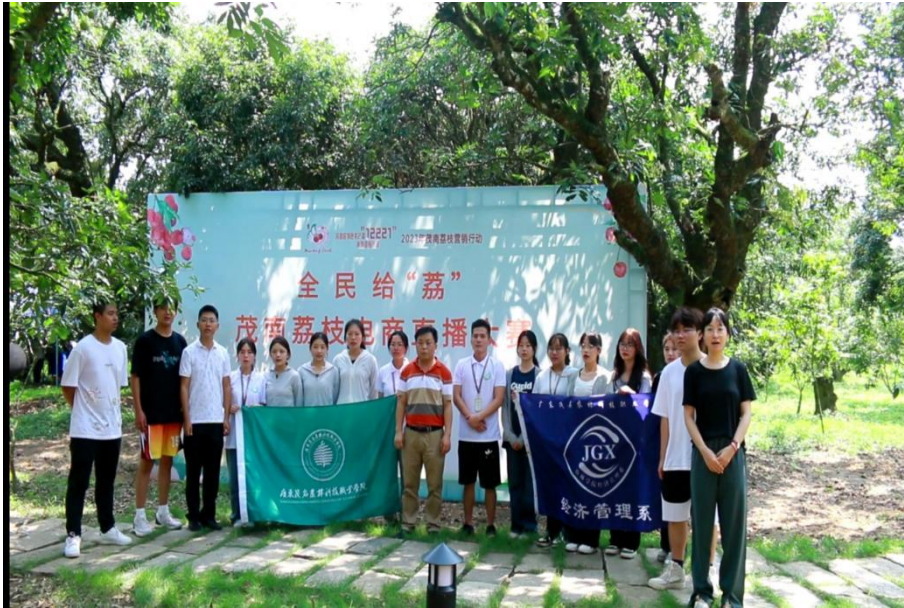
图1 师生团队参加“2023全民给荔·茂南荔枝直播大赛”启动仪式